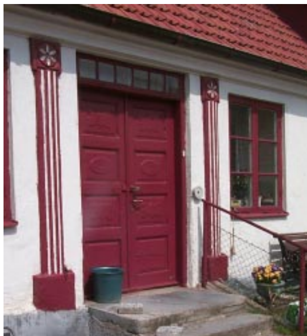
Entrépartiet på Gårdlösa 54:1.

har fått tillbaka det utseende de hade förut, det vill säga spröjsade tvåluftsfönster. Bostadslängan på gård Gårdlösa 69:4 är ett sådant exempel. De ursprungliga trä och järnfönstren med spröjs finns kvar på många av husen, framförallt på uthuslängorna som inte utsatts för lika stort förändringstryck. Dessa detaljer sätter prägel på husen, precis som äldre pardörrar eller brädportar med bandgångjärn och smidesanordningar. De vanligaste dörrarna i äldre utförande är fyllningsdörrar med eller utan utsnidade mönster.