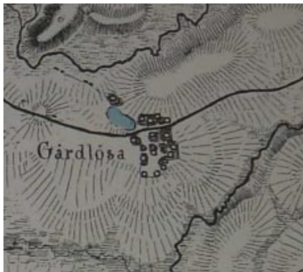
Skånska rekognoseringskartan från 1812-20.

År 1767 hade Gårdlösa ett flertal skattehemman och sju gatehus. De självägande skattebönderna var dock ålagda att utföra visst arbete på Smedstorps