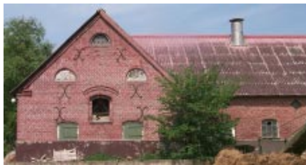
Ekonomilängorna på Gårdlösa 2:2.

Det kulturhistoriska värdet hänför sig till att gården är så väl bevarad. Alla husen som tillhör gården finns kvar, alla dock inte i lika gott skick som huvudbyggnaden, och de är fortfarande hållna i samma stil. Detaljer så som fönster och dörrar i äldre utförande är bevarade.