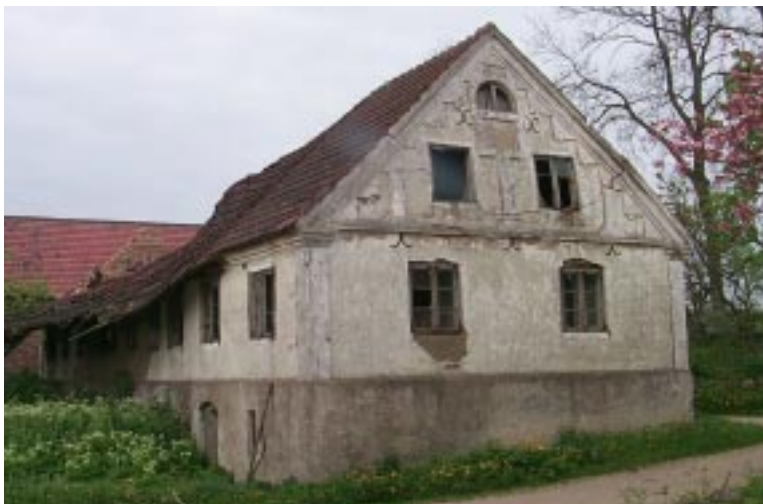
Ett av boningshusen på Gårdlösa 7:23.

I rapporten till föregående inventeringen är hela Gårdlösa klassad som värdefull, medan vissa hus anses vara "kulturhistoriskt och/eller miljömässigt värdefulla byggnader". I den senare kategorin