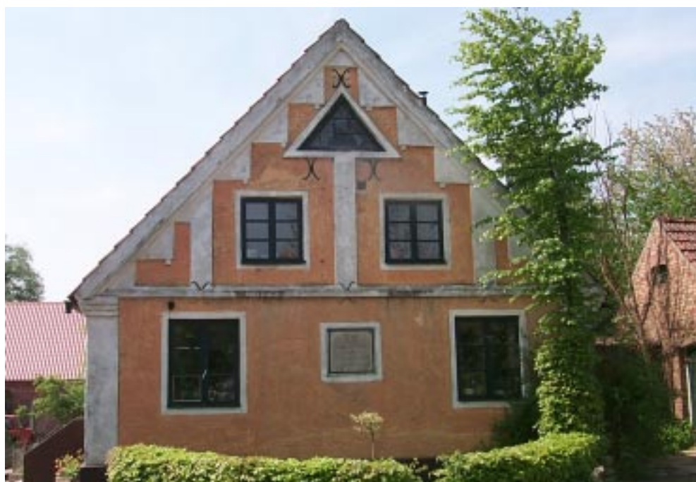
Boningshusets östra gavelparti och den boxbomsinhägnade trädgården på 2:2.

En av de gårdar som sammanslagits och på grund av denna anledning inte längre bebos är den västligaste belägna gården tillhörande fastighet Gårdlösa 7:23. Enligt den numera nedtagna tavlan är boningslängan som ligger utanför själva gårdskvadranten uppförd 1874. Byggnaden är i mycket dåligt skick. Taket har rasat in och den förr så resliga gaveln är på väg att knäckas på mitten av takets tyngd. Genom de avflagnande ytskikten har de underliggande konstruktionen kommit i dager. Takspån, lergjutna