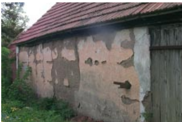
En av ekonomilängornas väggar består av gjuten lera.

Att boningshuset är förfallet påtalades redan vid den föregående inventeringen och då inget har gjorts är det i ännu sämre skick idag. Genom att detaljer och gjuthusväggar finns kvar har det dock ett kulturhistoriskt värde. Boningshuset utgör en viktig del i den övriga gårdsbebyggelsen som fortfarande har kvar sin karaktär, varför man bör värna om hela gården.