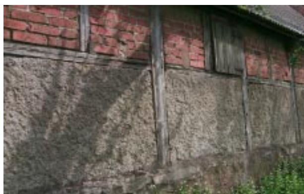
Kalkflis i korsvirkesfack, Gårdlösa 7:23.

Ett annat lokalt material är kalkstensflisen som använts i flera olika sammanhang. Den syns mest som fyllnadsmaterial i de nedre facken i korsvirkeshusen och trädgårdsstaket. På den sydöstra gården till fastigheten Gårdlösa 7:23 har kalkstenen använts som staket på gårdsplanen och i korsvirkesfacken. I en av uthuslängorna är hela muren uppförd i murad kalkflis. I vissa hus har man använt flisen i bygandet av grunden eller inomhus som golvmaterial och bordsskivor. Både kalksten och lera fanns lättillgängligt. Lertäckten vid bykärret och stenbrottet försörjde byborna med byggnadsmaterial vilket kom att ge prägel åt bebyggelsen.