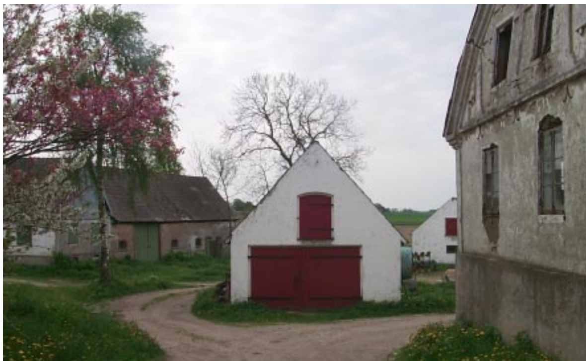
En del av den södra gårdsbebyggelsen på Gårdlösa 7:23.

I Gårdlösa finns ett drygt 60-tal byggnader varav femton är bostäder. Resten utgörs av förråd, garage