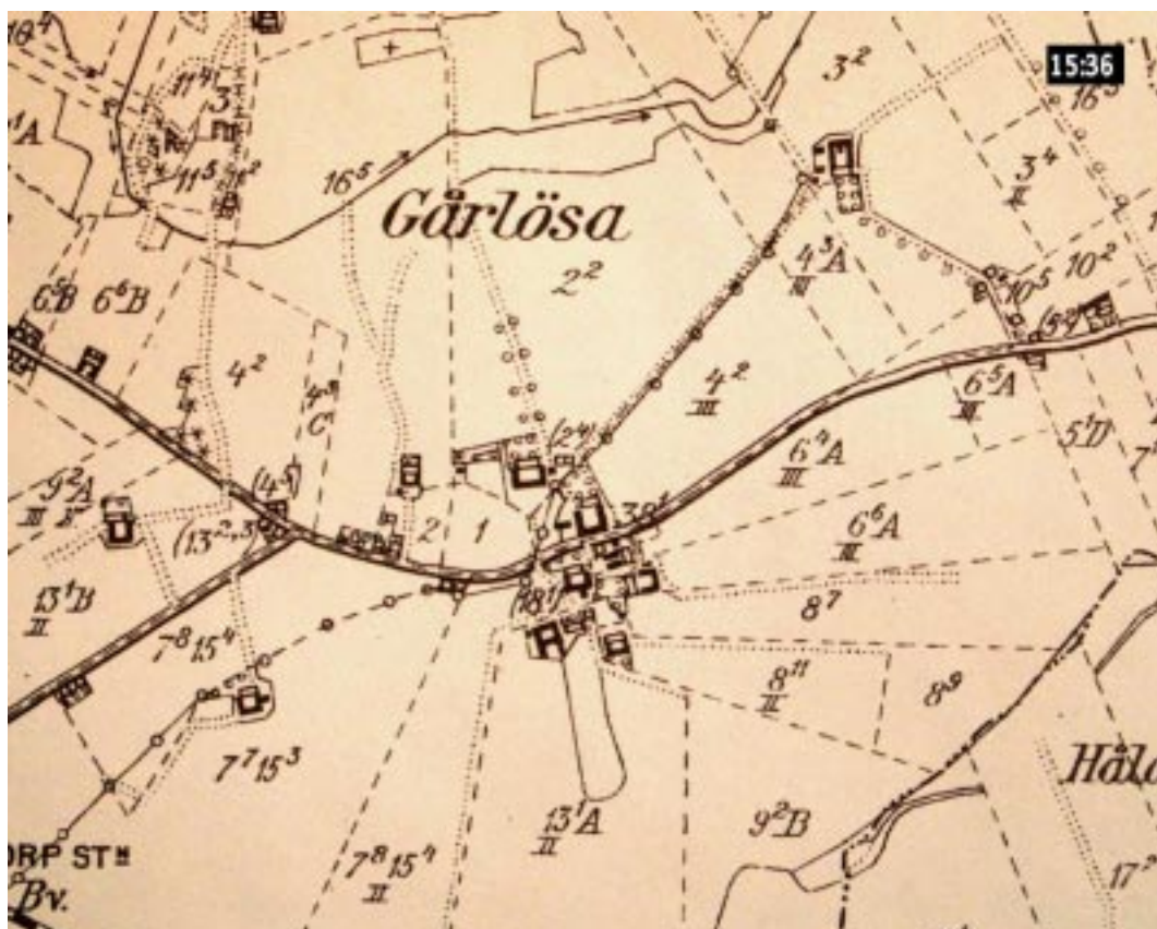
Häradskartan från omkring år 1930.

Enligt skånska rekognoseringskartan (1812-20) finns det endast en väg i Gårdlösa och det är genomfartsvägen från Smedstorp österut mot byn Stiby (nuvarande Gärsnäs). Sträckan från byn mot Smedstorp ligger än idag helt oförändrad. Den är än idag en grusväg och har behållit sin lite slingrande vägsträckning. Då byn skiftades anlades flera nya linjeräta vägar.