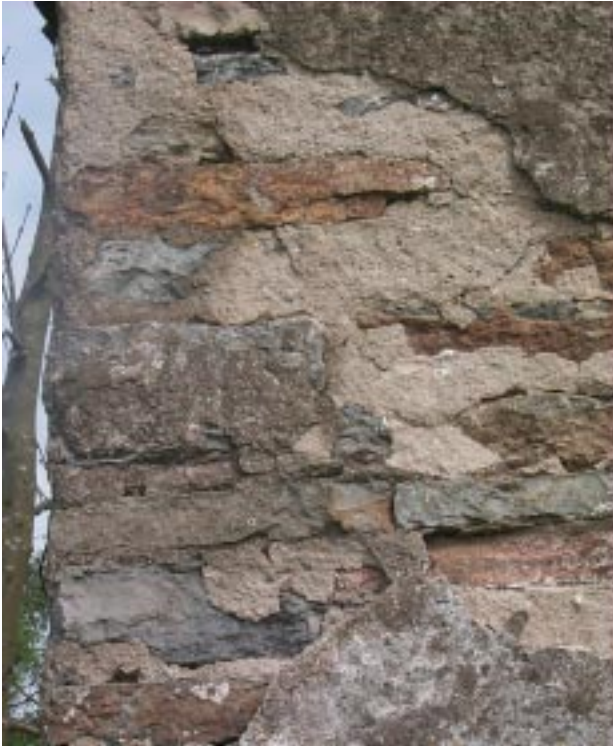
Väggar och socklar i kalkflis är ett karakteristiskt byggnadsmaterial i Gårdlösa.