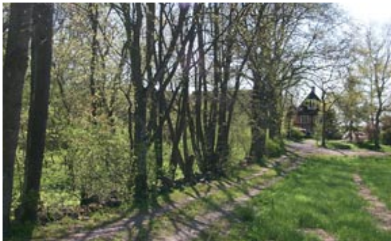
En av de allékantade grusvägarna till gårdarna som ligger ut- spridda i en solfjädersform i söder.

I Från Bjäre till Österlen. Skånska natur- och kulturmiljöer omnämns inte bara byn utan även Tranås fälad och Tranås lund som ligger nordväst om byn. Fäladen beskrivs som en välbevarad del av byns utmark. Betesmarken består bland annat av eneträd, hassel, hagtorn och nypon medan det i lunden till största delen växer avenbok. I ängs- och hagmarksinventeringen pekats två områden ut som kulturhistoriskt värdefulla: solbacken eller Tranås fälad väster om bytomten och Bokedala nordöst om bytomten. Solbacken har mycket lång kontinuitet av betesmark eftersom det tidigare va- rit utmark. Bokedala är en föredetta ängsmark.