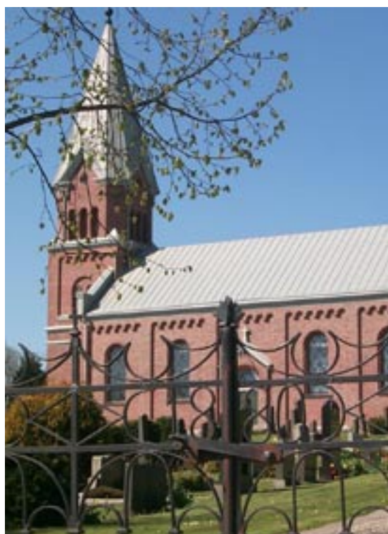
Smidesstaketet som daterar kyrkan till 1880.

Tranås röda tegelkyrka ligger på ett backkrön omgiven av kyrkogården och det öppna landskapet. Av den medeltida kyrkan som år 1880 ersattes av den nuvarande finns endast en del inventarier kvar, däribland dopfunten och en silverkalk. Fasaden är förhållandevis enkel men har den för nygotiken kännetecknande tegeldekoren i rundbågesimser och tornets fönstergallerier. De nygotiska inslagen är blandade med mer strama nyklassicistiska drag som profilerade lister i betong och lisener som markerar hörn och travéer. De rundbågsvalvda fönstren är för-