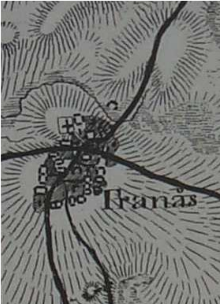
Skånska rekognoseringskartan från 1812-20 visar en stor tät by invid en vägkorsning.

gårdar i byn självägande. Endast en gård var frälsehemman, det vill säga att det tillhörde ett säteri. Gården låg under Esperöds säteri som var beläget i den västra delen av socknen.