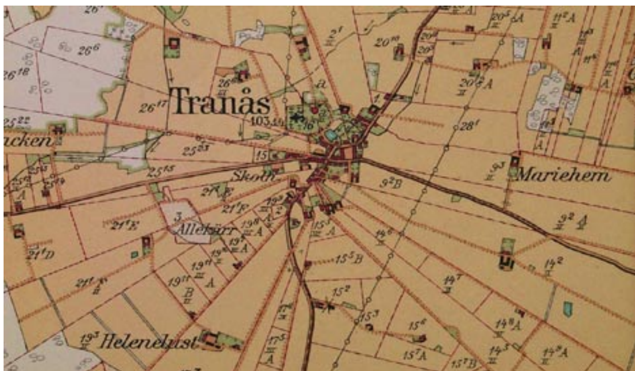
Häradskartan från omkring 1930. Skiftena strålar ut från byns centrum och landsvägarna går fortfarande genom byn.

I Norrevång finns också en stor backe. Denna är benämnd Högtyttet och här kan man se flera kyrkor och byar. Under denna backe finns Högtyttekiällan. Sydväst om Högtyttet finns en alskog benämnd Lunderijs. Söder om Högtyttet finns en mosse benämnd Stiernemosse. Denna består av björk och rönnbuskar. Här finns en källa benämnd Bobbekiällan som förr i tiden skall ha varit en offerkälla. Man har hittat penningar här. Denna ligger norr om byn.