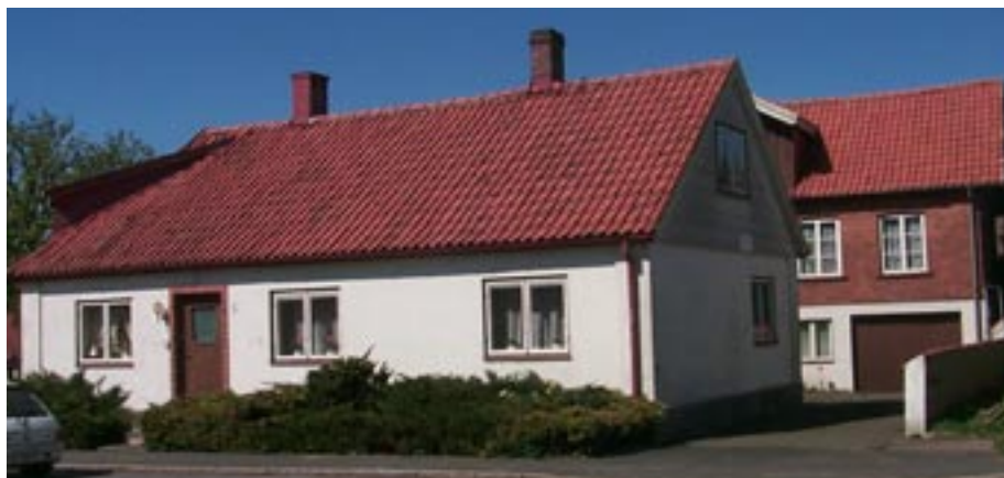
Affärs- och bostadshuset vid torget och Tranesvägen.

Byggnaden har i allra högsta grad ett kulturhistoriskt värde, inte bara på grund av de många originaldekorationerna, den har även en betydelse för byns historia som handelsknutpunkt. Den utgör också en viktig del av de allmänna platser som nyttjats och ägts av byborna gemensamt.