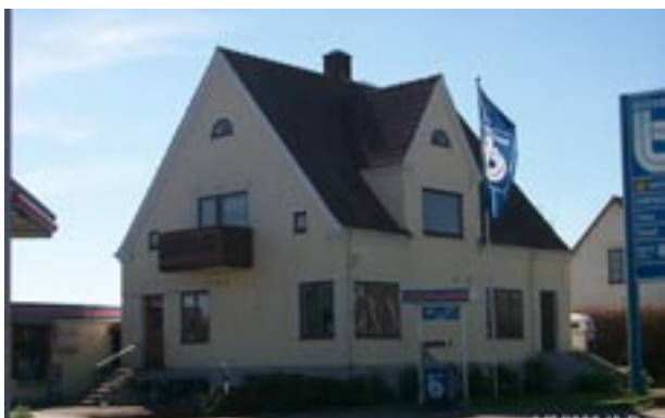
Bensinmacken ligger på 9:24 vid Tranesvägen.

Ett drygt 20-tal byggnader tillkom under 1930- och 1940-talen. De flesta av dessa ligger i byns östra delar, framförallt vid korsningen av riksvä-