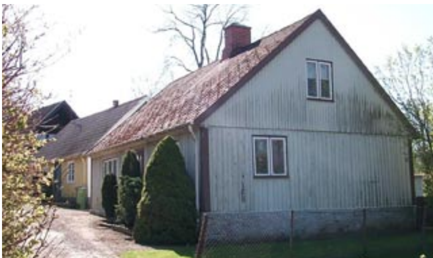
Bakom huvudgatan ligger husen tätt utmed grusvägar. Närmast i bild är 9:20 och där bakom 9:22.