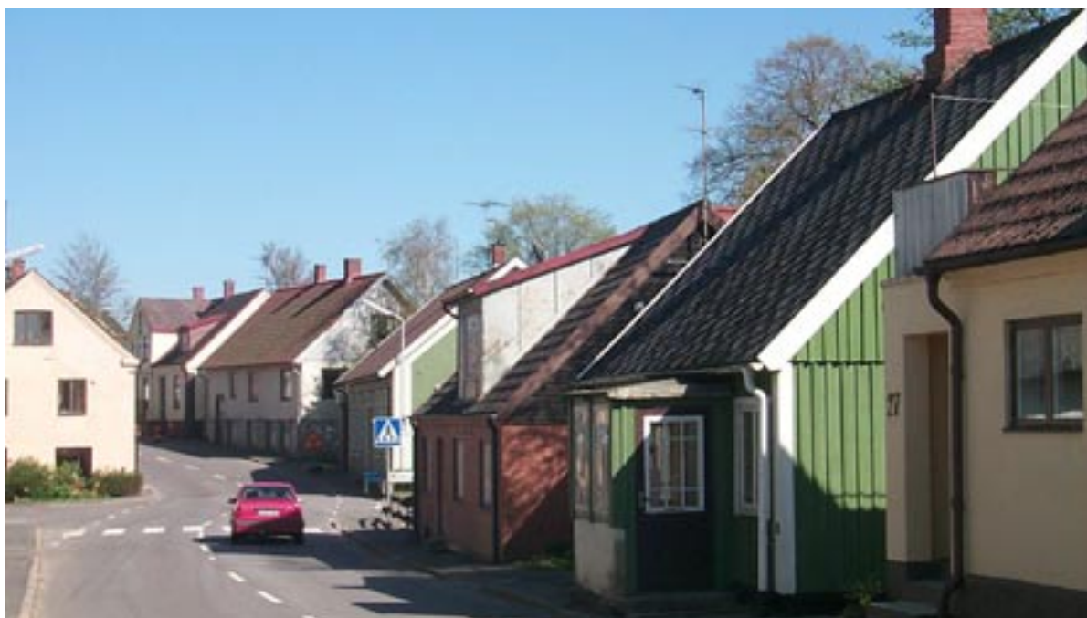
Längs den slingrande Tranesvägen ligger husen tätt.

De byggnader som tillkom under början av 1900-talet och fram till 1920-talet uppfördes i närheten av den äldre bebyggelsen medan de från 1930-talet och tiden däromkring är belägna utmed byns