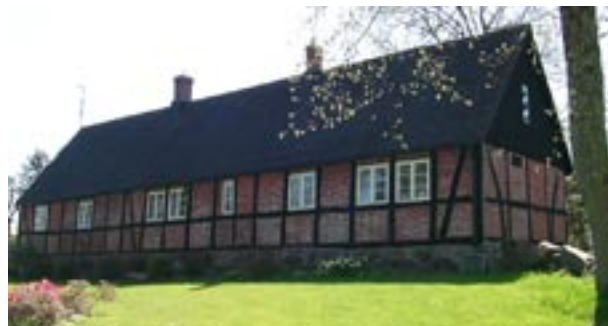
En av korsvirkeslängorna i södra delen av byn.

Ett tiotal byggnader är uppförda i korsvirke med antingen rött tegel eller vitmålad puts i fyllningarna. Resten av husen är antingen klädda med locklistpanel eller putsade. Ett karakteristiskt drag är att vissa sidor är panelade medan de mindre utsatta sidorna endast putsats. Den mest förekommande