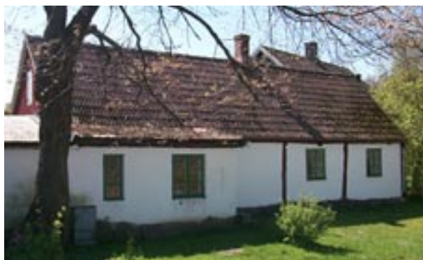
Baksidan på fastigheten 25:57

Ett hus som fortfarande har puts på de skyddade sidorna och panel på övriga är Tranås 25:57. På baksidan har den glesa timmerkonstruktionen, bestående av två stolpar, hammarband och bjälkändar, lämnats synlig. De två stora facken är putsade och avfärgade i vitt. Halva fasaden täcks av tillbyggnaden som delvis byggts i tegel och sträcker sig fram till grannhuset. Även tillbyggnaden och gavlarna har målats vita. Framsidan och röstena är däremot klädda med rödmålad locklistpanel. Dörrarna är klädda med panel i fiskbensmönster med en glasruta i överdelen, ett utförande som återfinns på många hus i Tranås.