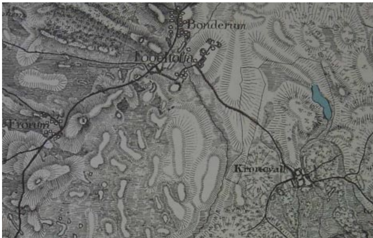
Fågeltofta, Bondrum och Kronovall på skånska rekognosceringskartan 1812-20.

Den äldsta lantmäterikartan visar ”Fullstofta kyrkobys inägor” år 1787. Eftersom utmarken inte