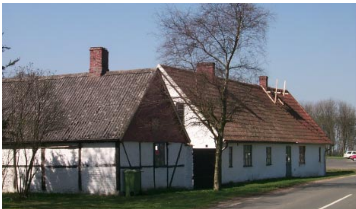
Fulltofta 25:5 och 25:2.

Till huset hör också ett uthus i vit slätputs och på några partier papp. Uthuset är täckt med ett sadel-