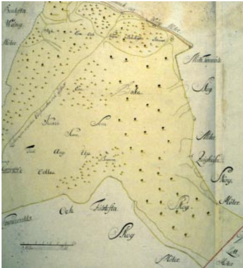
Kartan, en geometrisk avmätning av Bondrum, gjordes år 1749.

”nödig bok och surskog”. Med surskog menades alla lövträd förutom ek och bok.