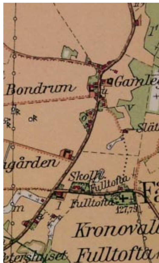
Den ekonomiska kartan från omkring 1930.

Det huvudsakliga trädslaget var sannolikt bok. På en enebacke i byns nordvästra hörn står benämnt ”boke-käskor”. I en beskrivning från 1767 omnämns