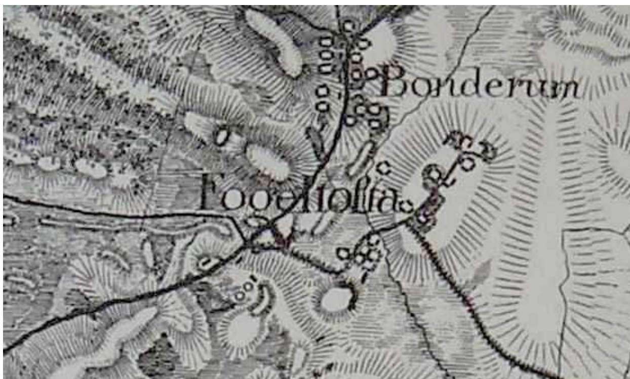
Skånska rekognoseringskartan från 1812-20.

Bondrums by skiftades sent på 1800-talet och skiftet fick stora konsekvenser för byn. Flera gårdar flyttades ut och gatehus har uppförts under 1900-talet på dess platser. Utmarken i norr togs i anspråk och under slutet av 1800-talet uppfördes här flera torp med nyodlingar. Torpen har sedan övergivits och likaså odlingarna.