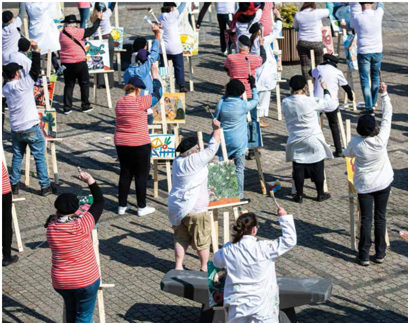
I april ägde filminspelningar rum på olika platser i Tomelilla, bland annat på torget som fyllts av statister i randiga tröjor och basstrar.