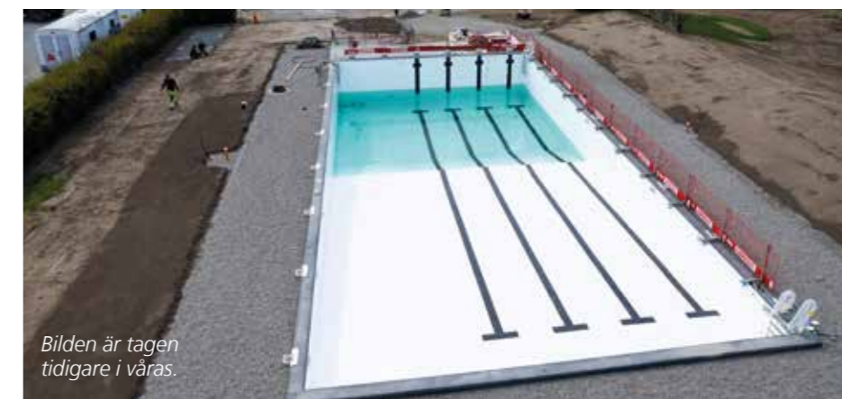
Bilden är tagen tidigare i våras.

En helt ny reningsanläggning har installerats som på ett mer effektivt sätt tar hand om klor och rening av vattnet. Den befintliga byggnaden med omklädningsrum, dusch och kiosk var