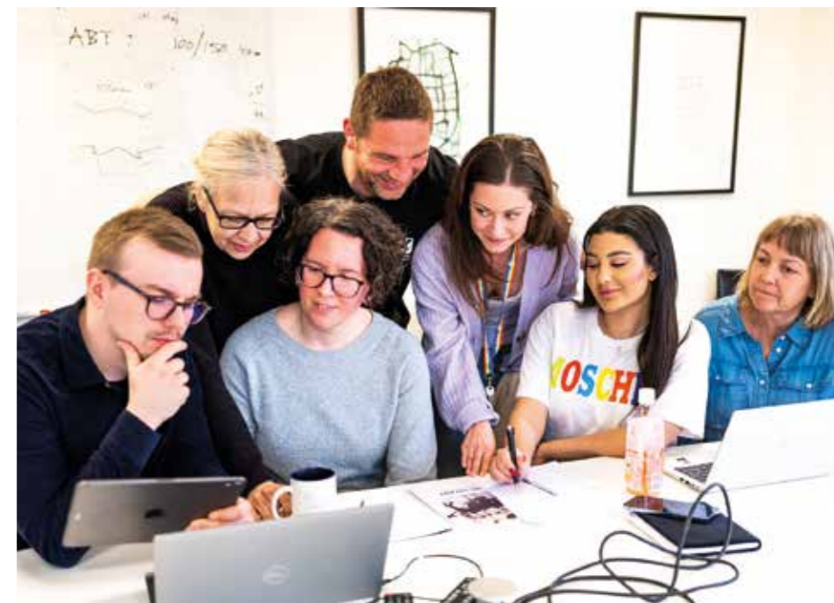
Under våren har representanter från kommunens verksamheter jobbat flitigt med att få ihop ett spännande sommarlovsprogram.

– Vi vill att sommarlovet som ska erbjuda barn och unga aktiviteter under hela sommaren. 2022 hade vi Skånes längsta sommarlovsprogram där vi