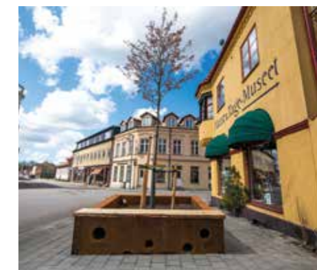
Lådan utanför muséet är i cortenplåt och har en sittbänk i trä på sidan mot trottoaren.

Lådan utanför muséet är i cortenplåt och har en sittbänk i trä på sidan mot trottoaren. Den har sina hål och är också placerad lite snett som om den gungar på vattnet. Trädet i lådan är av sorten storblommig häggmispel.