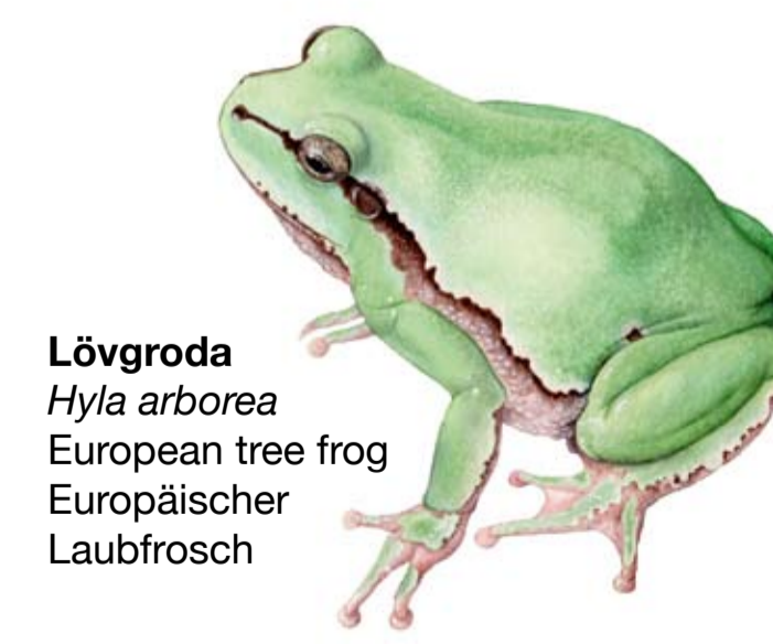
Lövgroda Hyla arborea European tree frog Europäischer Laubfrosch

Store Vångs busk- och lövrika marker erbjuder gott om mat och skydd för den vackra lövgrodan.