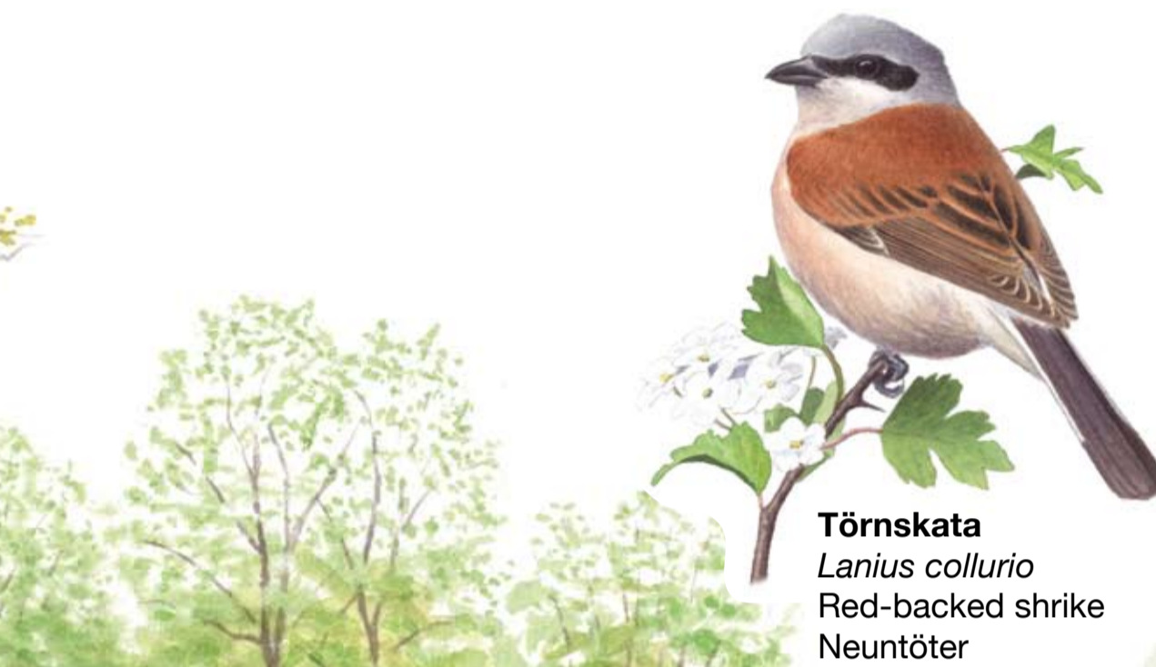
Törnskata Lanius collurio Red-backed shrike Neuntöter

Gamla trädjättar. I den betade lövskogen i söder växer lind, ek, bok och flera andra lövträd. Många av ekarna är gamla och vidvuxna. Här och var står grova, höga