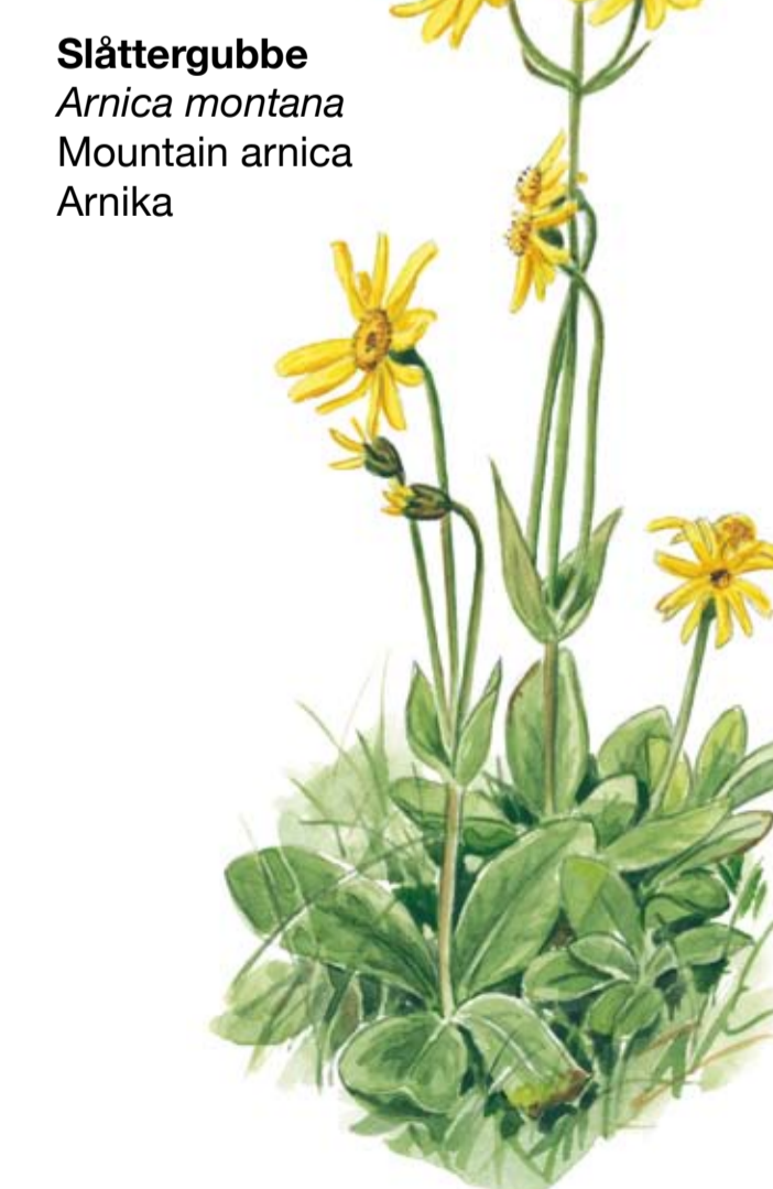
Slättergubbe Arnica montana Mountain arnica Arnika

Store Vångs busk- och lövrika marker erbjuder gott om mat och skydd för den vackra lövgrodan.