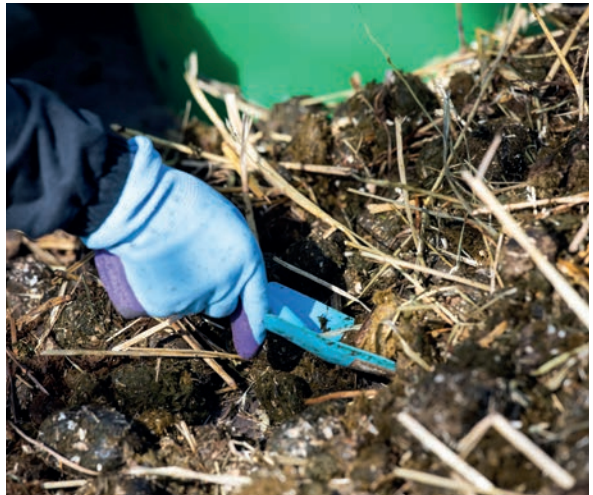
Hästgödsel var ett spännande inslag under dagen.