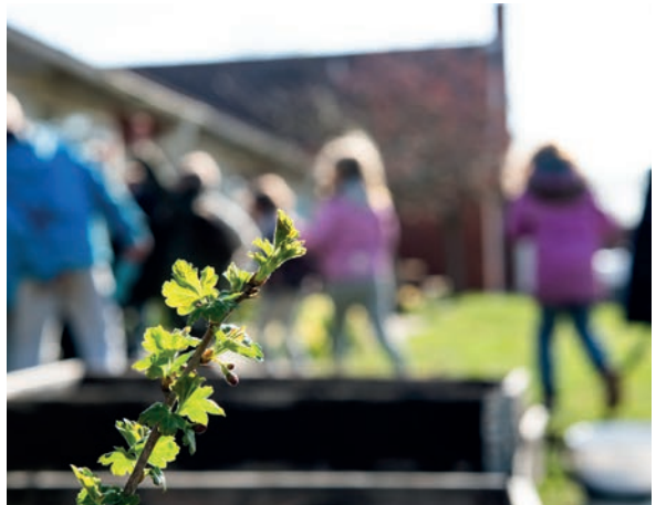
Många av eleverna kom iklädda arbetskläder på odlingsdagen. Färgglada trädgårdshandskar fick man låna av skolan.