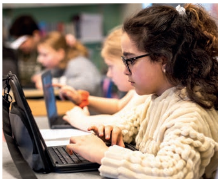
I Skolverkets mätningar finns ett resultat som sticker ut – eleverna på Brösarps skola är riktigt bra på matte.

– Vi är övertygade om att alla kan lära sig matte, vi jobbar mycket med för-