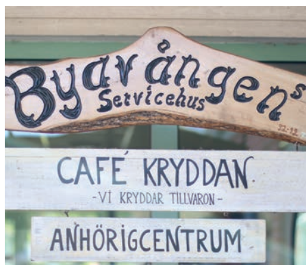
Café Kryddan ligger på Byavången i centrala Tomelilla.

I det ordinarie programmet finns bland annat bingo och caféverksamhet. Första bingotillfället blir den 30 augusti. Café Kryddan håller sommarstängt 4 juli–29 juli.