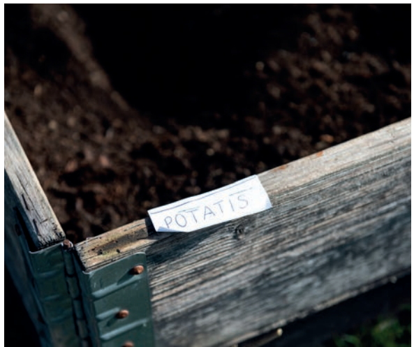
Potatis, rädisor och morötter var några av grödorna som eleverna på Odenslundsskolan sådde.