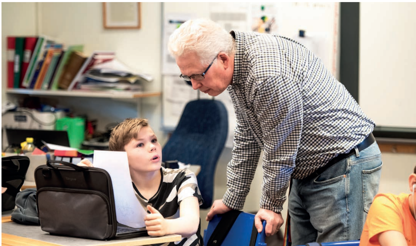
Eleverna i Tomelilla kommun ligger över riksnittet när det gäller godkända betyg i matte.