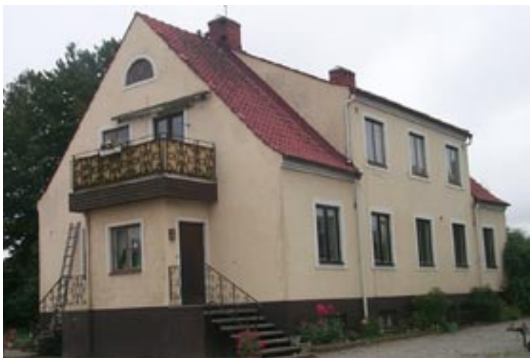
Lärarebostaden på Ingelsta 21:46