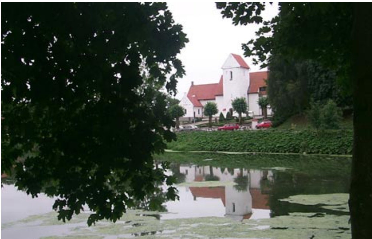
Den stora dammen i byns mitt kantas av träd som ger lummighet.