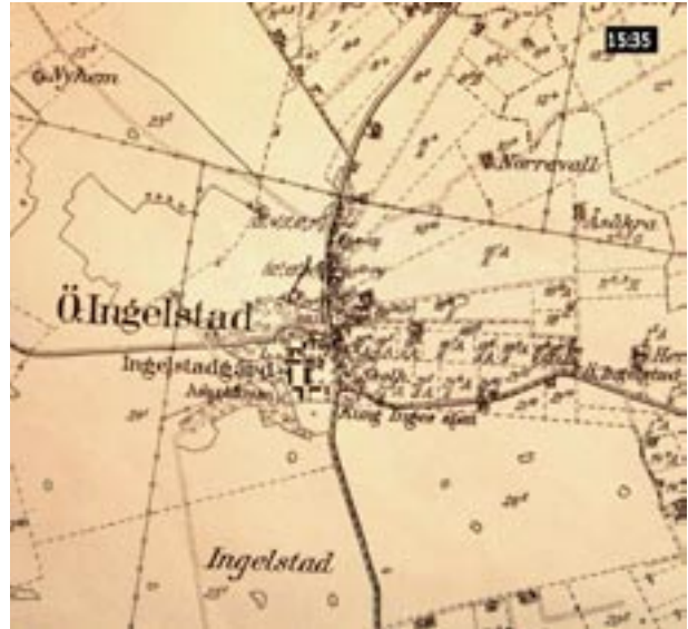
Till vänster ses enskifteskartan från 1824. Ovan den ekonomiska kartan från omkring 1930.

var indelad i tre vångar. Dessa benämndes Wärmöllekullswången, Kappelswången och Tjustorpewången. Hästhagen och ägorna till kvarnen var särhågnade specialskiften, som inte ingick i tresädet.