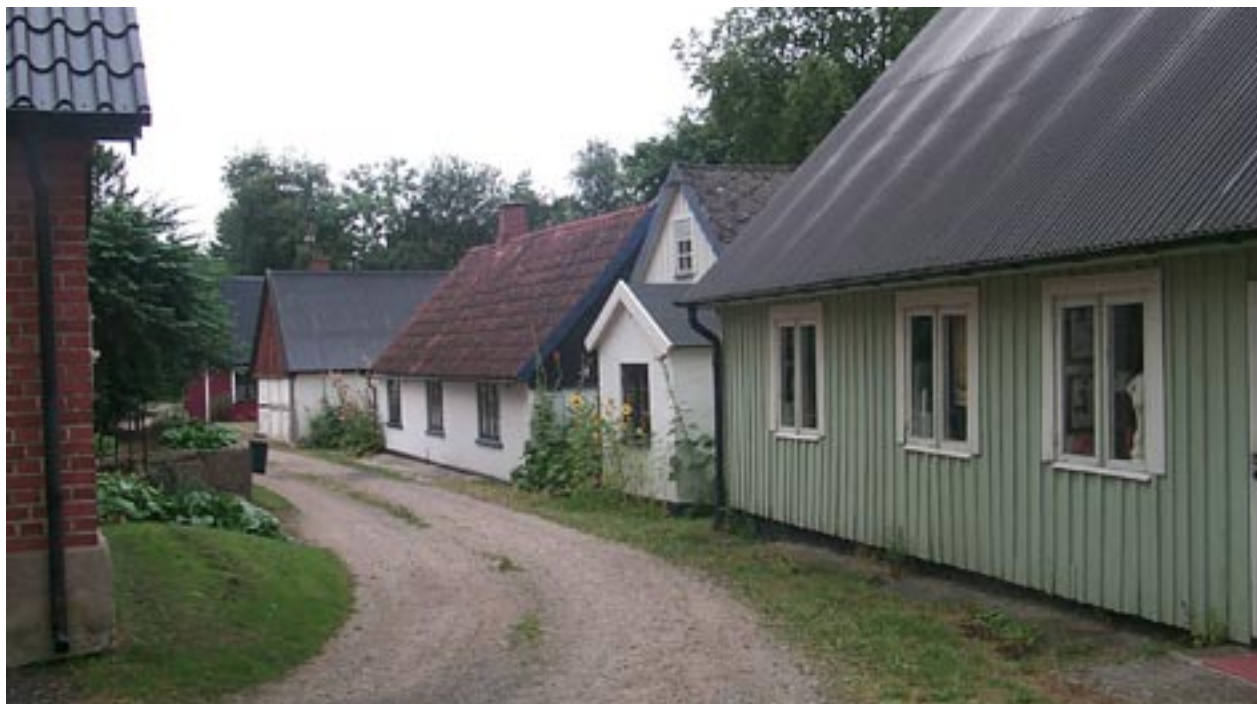
Korsvirke, slätputs, panel och tegel - i byn finns en mångfald av olika fasadutföranden.

kalkon med sina stora djurstallar som blivit ett populärt besöksmål.