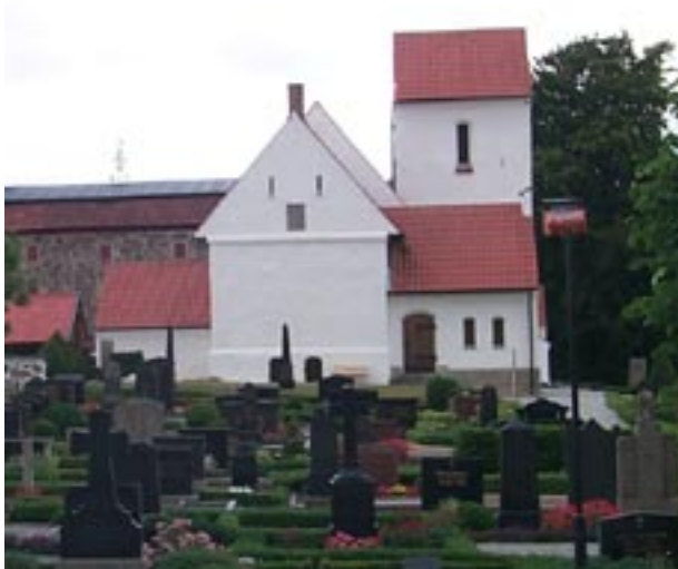
Kyrkan är uppförd under 1100-talet.

tegel, fasettlagda eternitplattor eller svart kor-rugerad plåt. Det finns också några papptak på trekantslist. I några fall är gavelrösten klädda med papp eller fasettlagd eternit.