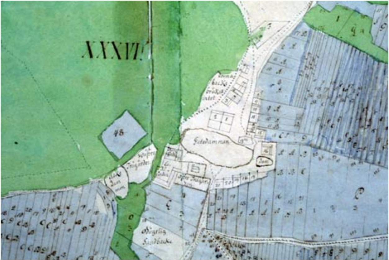
Östra Ingelstad år 1719.