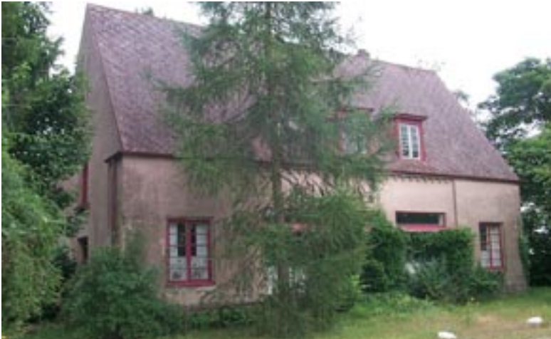
F.d. lanthandeln Ingelsta 24:4.

i stor grad kvar sina ursprungliga utformningar. Affären lades ned 1970.