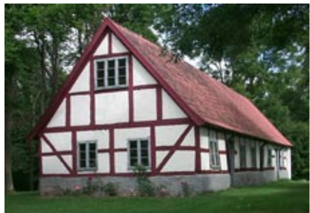
Den äldre korsvirkeslängan på Ingelsta gård.

Ingelsta gård är troligen mycket gammal som gårdsbildning. Det finns uppgifter om ett medeltida så kallat fast hus på platsen men det är sedan länge rivet. Gården består idag av en mängd olika byggnader. Boningshusets exteriör är ett resultat av ombyggnader som gjorts under 1930-talet. Huset har en klassicerande exteriör med en svagt utspringande mittrisalit krönt av en fronton. Mittrisaliten samt byggnadens hörn markeras med rusticerade hörnkedjor. Boningshuset är sammanbyggt med en vinkelställd länga. Strax norr om boningshuset ligger en äldre länga som delvis är uppförd i korsvirke med röd timra och vit puts. Längan kan vara uppförd 1738 eller kanske till och med tidigare. Takformen är ålderdomlig med sin något utsvängda takfot, taket är belagt med enkupigt rött tegel. I huset finns bland annat en äldre spegelindlad pardörr och äldre fönster med ålderdomliga beslag.