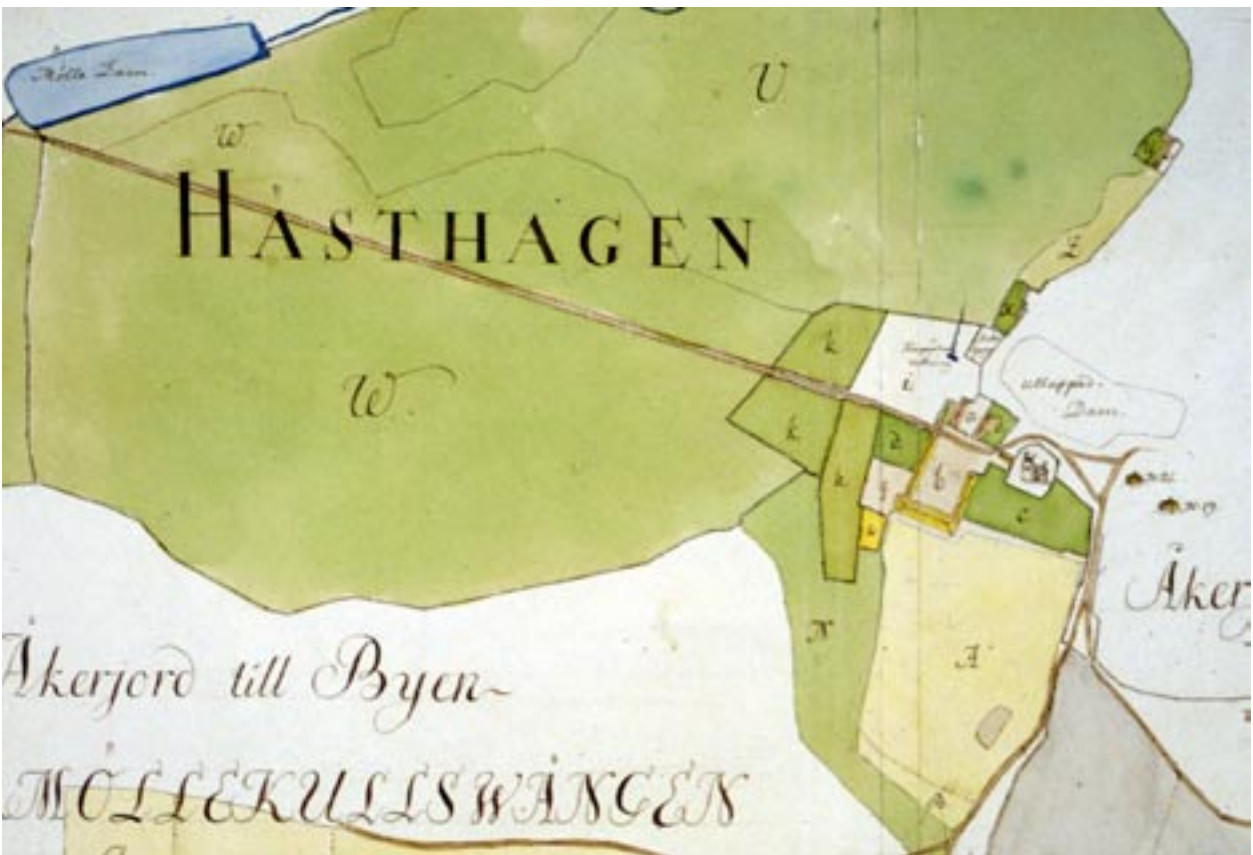
Östra Ingelstad år 1776.