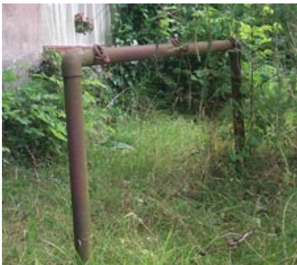
Små detaljer kan vara viktiga för att förmedla kunskap om det förflutna. Vid denna bom, i dessa ringar, fäste man hästen vid besök i affären.

uppfattas. Ett äldre fönsterglas har estetiska kvalitéer som ett nyttillverkat glas inte besitter. Bågar och spröjs är avpassade efter byggnaden och gjorda för att passa just där. Att ersätta ett sådant fönster med ett fabriksstillverkat ger byggnaden ett mindre kulturhistoriskt värde. Även dörrar som är utformade efter byggnaden bör restaureras istället för att bytas ut. Lika lite som man skulle drömma om att sätta in en ny byrålåda i en äldre byrå borde man sätta in en ny icke anpassad dörr i ett äldre hus. Tänk på att underhåll och små reparationer alltid blir billigare än att köpa nytt. Om man trots allt väljer att sätta in nya fönster är det att föredra om man väljer de befintliga som förlaga.