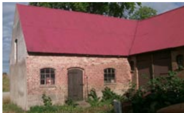
Gården Östra Ingelsta 10:10

Villan är en typ av byggnad som man oftast hittar i stationsområden. Den skiljer sig från de traditionella bostadshusen. Huset är byggt i vinkel och indraget något från tomtgränsen. Det har putsade fasader med lister och en frontespis över ett avfasat hörn vilket visar på att huset är tänkt att ligga i ett kvartershörn.